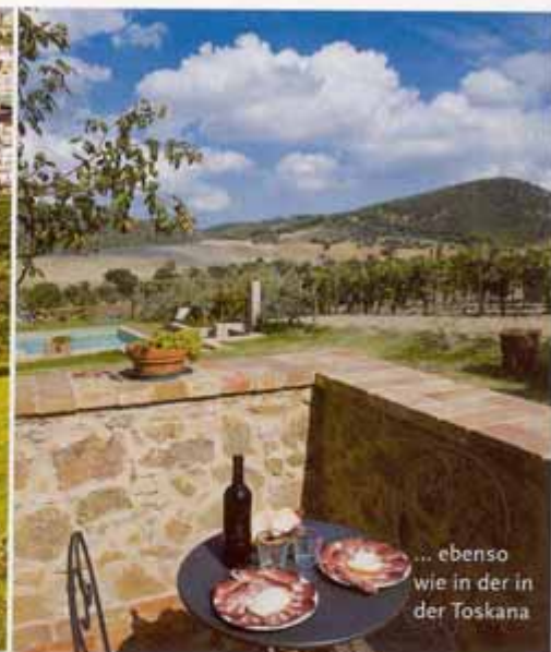
... ebenso wie in der in der Toskana